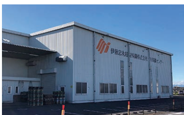
特殊鋼センター（群馬県前橋市）