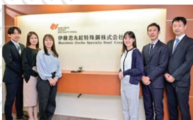
本社（東京都中央区茅場町）