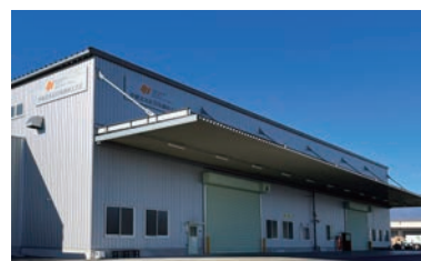
ステンレスセンター（群馬県桐生市）